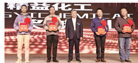
监理单位优秀项目总监及管理者