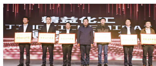
优秀设计单位和优秀技术合作商