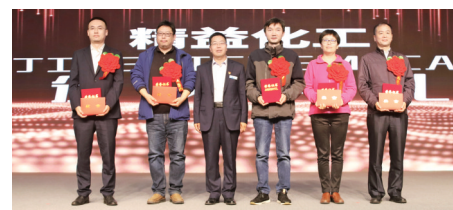
设计单位优秀项目经理