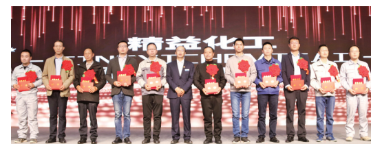
施工单位优秀项目经理及优秀管理者